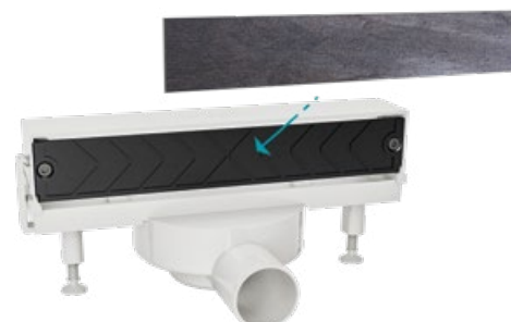
CANIVEAU DE DOUCHE MURAL SARRAT MODÈLE À REVÊTIR