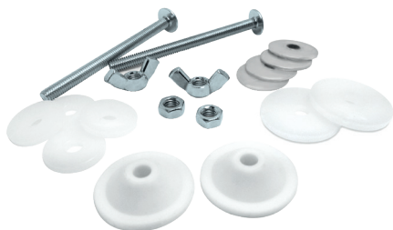
KIT DE FIXATION RÉSERVOIR INOX 6048A00 KIT DE FIXATION RÉSERVOIR GALVANISÉ 6020A06