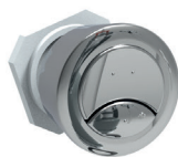
BOUTON POUSSOIR 61ABA04