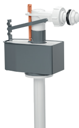
ROBINET FLOTTEUR COULISSANT 6152A00