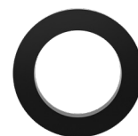
JOINT DE SEPARATION Ø 108X73.5X15 38C4A00