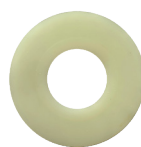
JOINT OBTURATEUR MECANISME 61C7A00