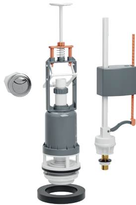
ENSEMBLE MÉCANISMES AVEC FLOTTEUR ALIMENTATION BASSE ET EMBOUT EN LAITON 61E6A00