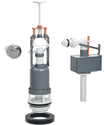
ENSEMBLE MÉCANISME DE CHASSE À BOUTON POUSSOIR AVEC FLOTTEUR COULISSANT 61AHA00