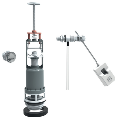
ENSEMBLE MÉCANISME À BOUTON POUSSOIR AVEC FLOTTEUR CLASSIQUE 61ANA00