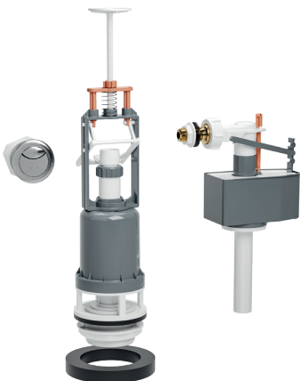
ENSEMBLE MÉCANISME DE CHASSE À BOUTON POUSSOIR AVEC FLOTTEUR COULISSANT ET EMBOUT EN LAITON 61ALA00