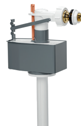
ROBINET FLOTTEUR COULISSANT AVEC EMBOUT EN LAITON 61A6A00