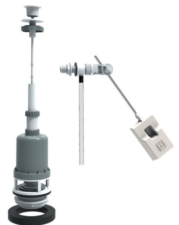
MÉCANISME DE CHASSE À TIRETTE 6139A08